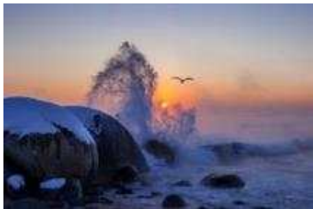
희망의 일출