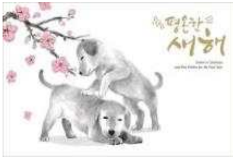
행복 가득한 새해 [(주)가나씨애피]