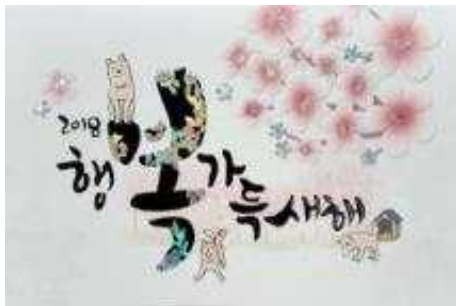
행복 가득한 새해 [(주)가나씨애피]