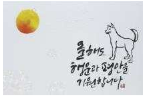
행복 한가득 [성창지공사]