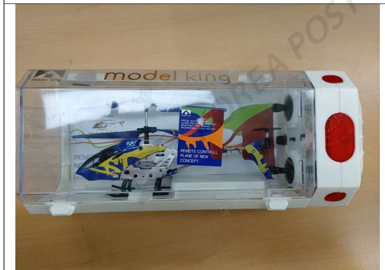
3번. 헬리콥터 드론