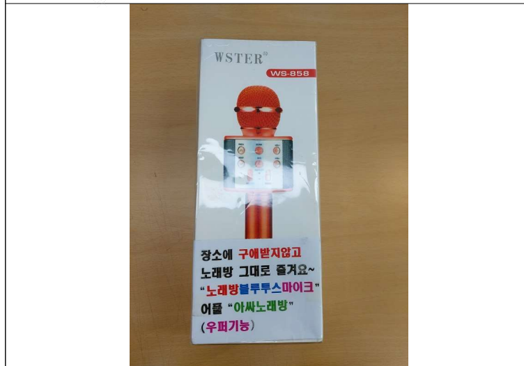
2번. 휴대용 노래방 마이크