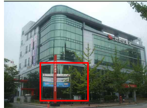
청사 전면 임대 예정 공간

* 사용자가 대상공간 조성공사 후 실제 공간은 위의 도면과 소폭 다를 수도 있습니다.