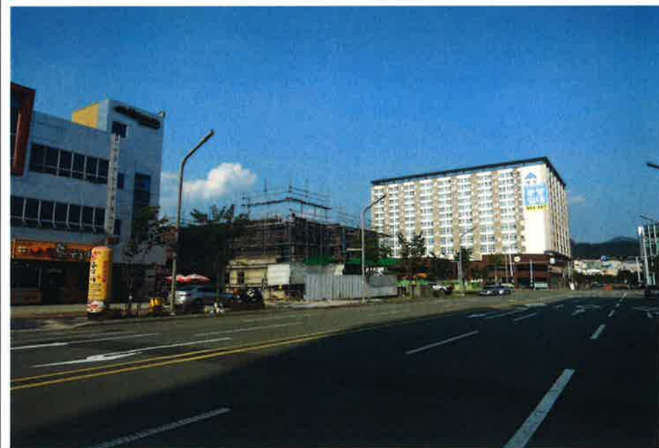
본건 주변 전경(남서측에서 촬영)