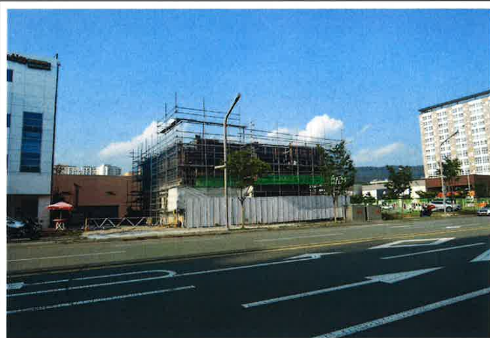
본건 전경(남서측에서 촬영)