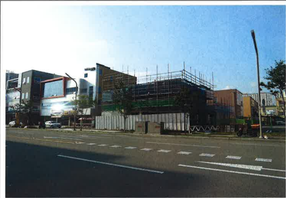
본건 전경(남동측에서 촬영)