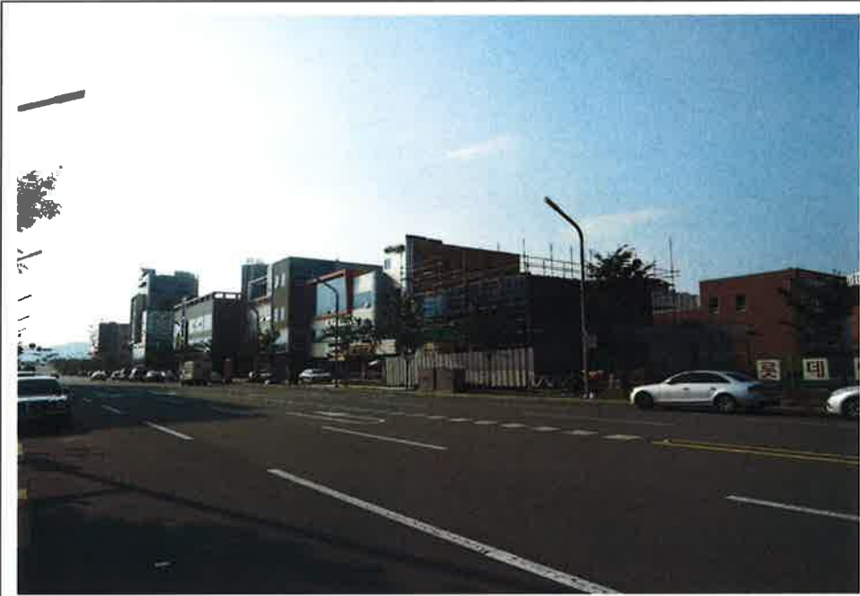
본건 주변 전경(남동측에서 촬영)